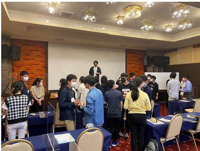
咸臨丸メンバーとの合同研修