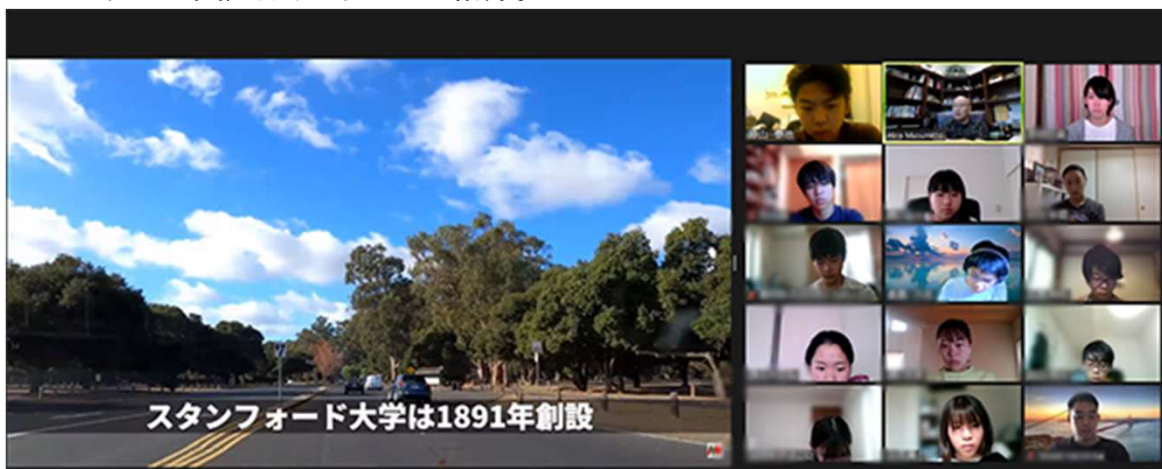
バーチャルシリコンバレーツアー

シリコンバレーの主な企業や歴史のある施設、街並みなどの映像を見ながら、またリアルタイムのライブ中継も交えながらの紹介。