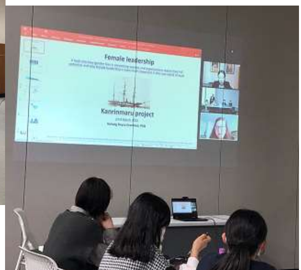
Solveigさんオンライン研修