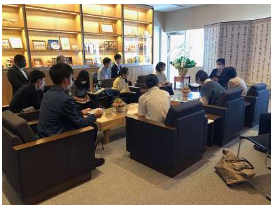
中山石垣市長との面談