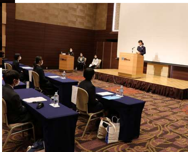
奨学生からの活動報告