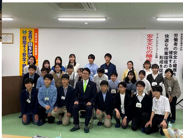
起業家育成メンバーも一緒に出雲社長を囲んで