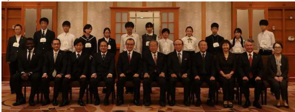
2021年10月24日(日) 結成式 2

「緊急事態宣言」解除後の2021年10月24日(日)には、長野市にて結成式を開催いたしました。