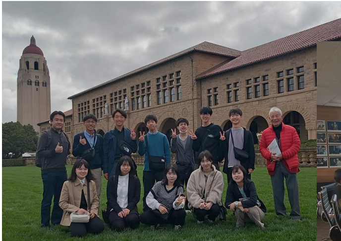
スタンフォード大学