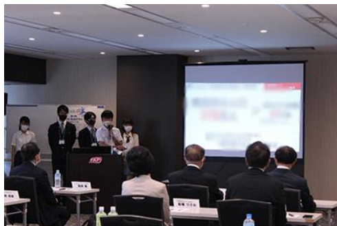
ビジネスプラン発表

第4回「AOKI起業家育成プロジェクト」においては、同感染症の影響で2022年4月開催予定の修了式が延期となり、2022年9月23日(金)に改めて修了式を開催いたしました。修了式では、3グループによるビジネスプラン発表会及び個人の決意表明が実施されました。