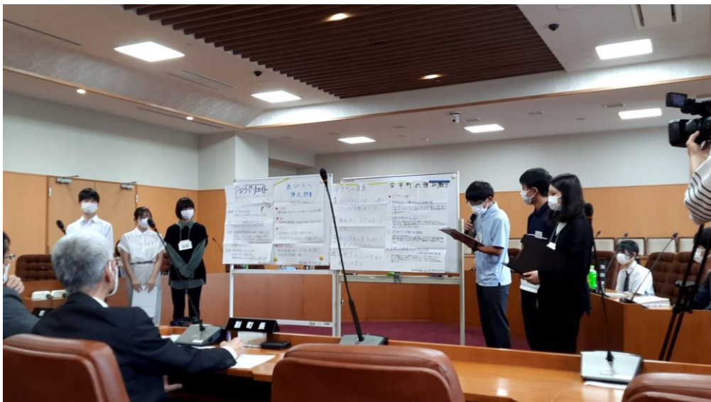
北海道・安平町への提言の様子