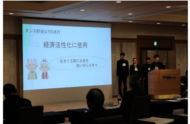
政策提言のプレゼンテーション